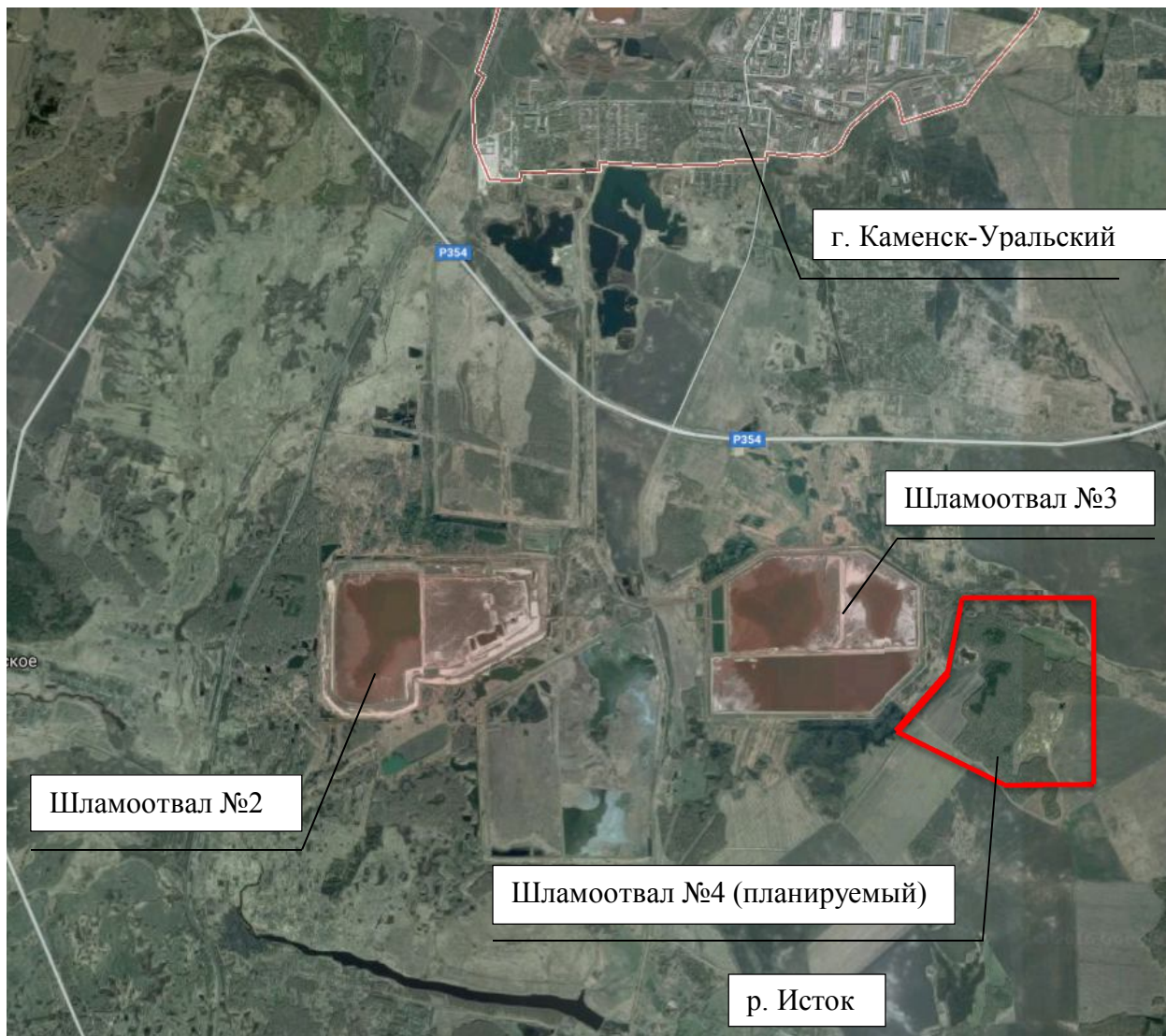
Рисунок 2.1 – Ситуационный план расположения шламоотвала №4

Ситуационный план расположения шламоотвала №4 АО «РУСАЛ Урал» «РУСАЛ Каменск-Уральский» представлен на рисунке 2.1.